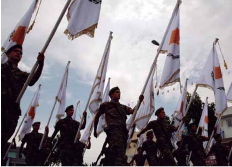
Soldados greco-chipriotas participan en un desfile militar celebrado con motivo del 52 a aniversario de la independencia de la República de Chipre.

En la República de Chipre la defensa está encomendada a la Guardia Nacional, cuyo entrenamiento está calcado de las FAS griegas. Creada en 1964 y entonces integrada por un 60 por 100 de greco-chipriotas y un 40 por 100 de