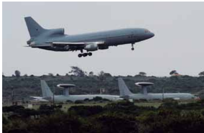
Un avión británico Tristar aterriza en la base aérea de Akrotiri, cerca de aviones AWACS , en la operación en Libia en 2011.

Anastasiadis. Las conversaciones con la parte griega se iniciaron el 15 de mayo y la UE sigue atentamente el proceso, al igual que la ONU. La autoridad turco-chipriota mantiene negociaciones con el presidente de la Comisión Europea, Jean-Claude Juncker, que ha visitado en julio oficialmente la RTNC y mantenido conversaciones con Akinci y Anastasiadis. Juncker —que calificó la situación de inaceptable y perjudicial para ambas partes— también se reunió con el enviado especial del secretario general de la ONU para la cuestión chipriota, Espen Barth Eide, y reiteró el pleno apoyo de la Comisión Europea a la tarea de unificar la isla. Hay posibilidad de un referéndum en este sentido antes de mayo de 2016, declaró el enviado de Naciones Unidas. Por primera vez, en su opinión, «se dan