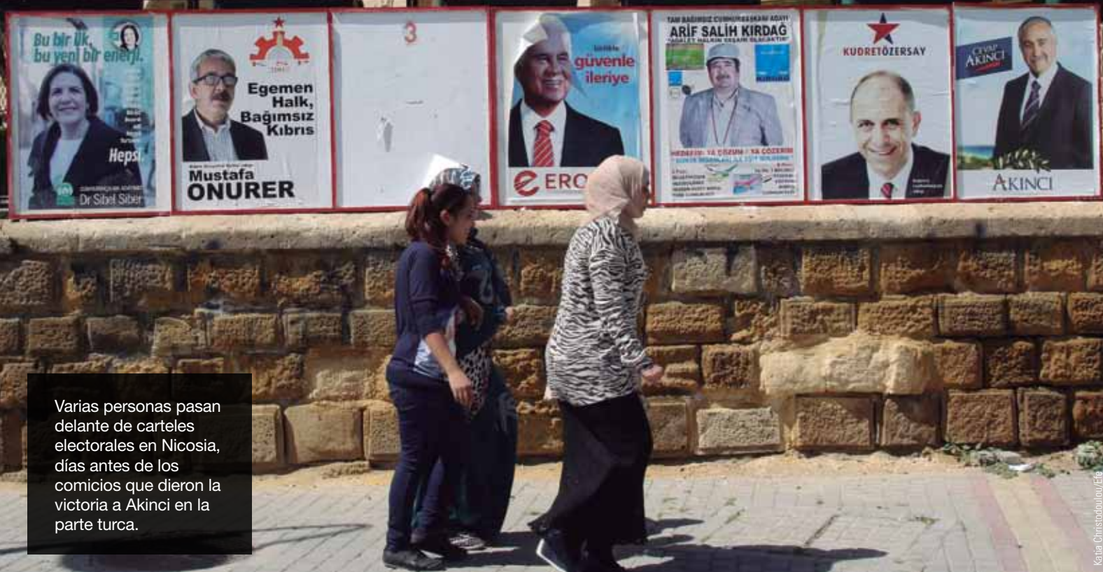
Varias personas pasan delante de carteles electorales en Nicosia, días antes de los comicios que dieron la victoria a Akinci en la parte turca.