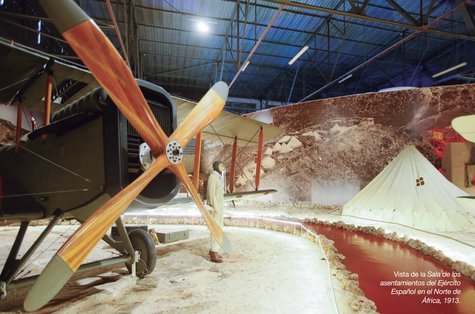
Vista de la Sala de los asentamientos del Ejército Español en el Norte de África, 1913.