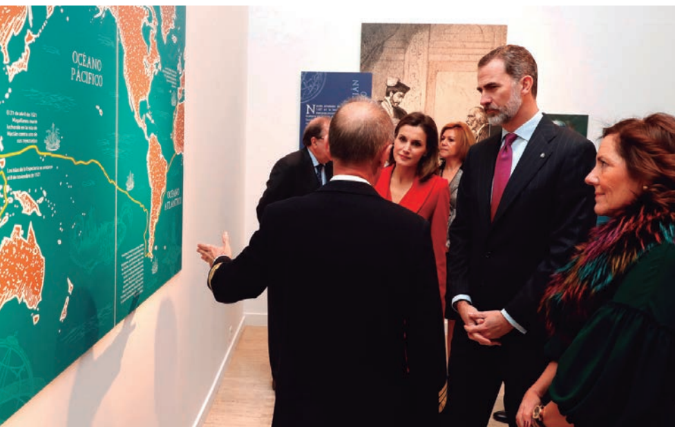
Los Reyes contemplan el mapa que muestra la ruta seguida en la expedición.