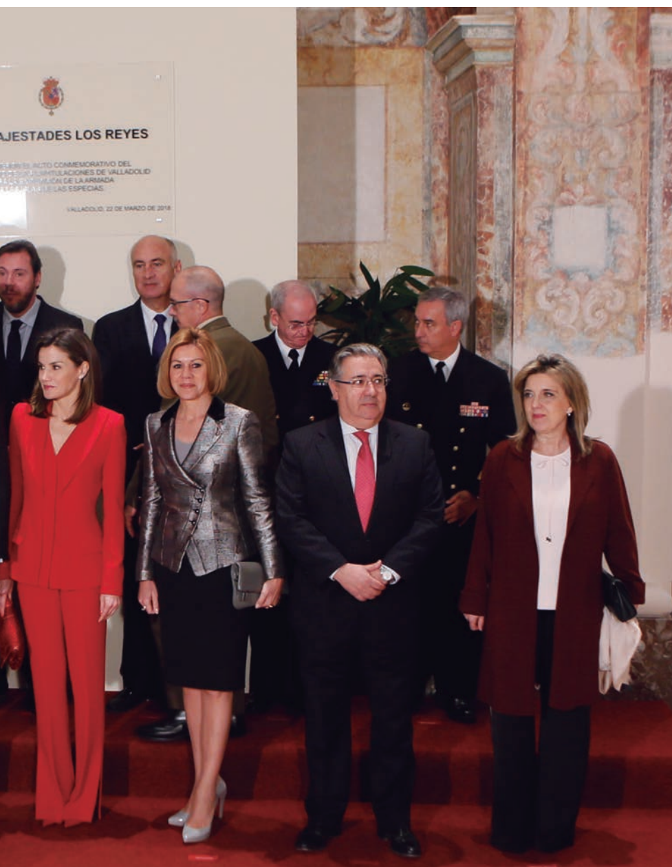
presidenta de las Cortes de Castilla y León, Silvia Clemente; ministro de Exteriores, Alfonso Cospedal; de Interior, Juan Ignacio Zoido; y la delegada del Gobierno, María José Salgueiro.

ción de la firma de las Capitulaciones y Magallanes