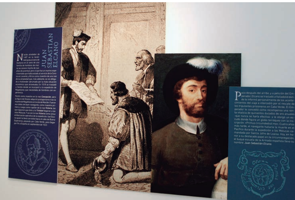
Los paneles recuerdan los principales datos de la vida de Magallanes y Elcano.