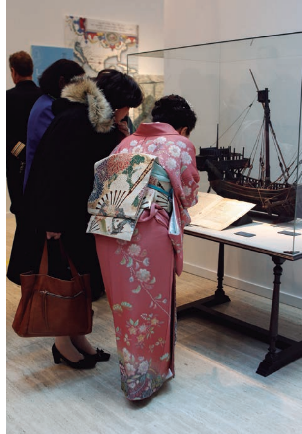
Los visitantes se interesan por los objetos expuestos.