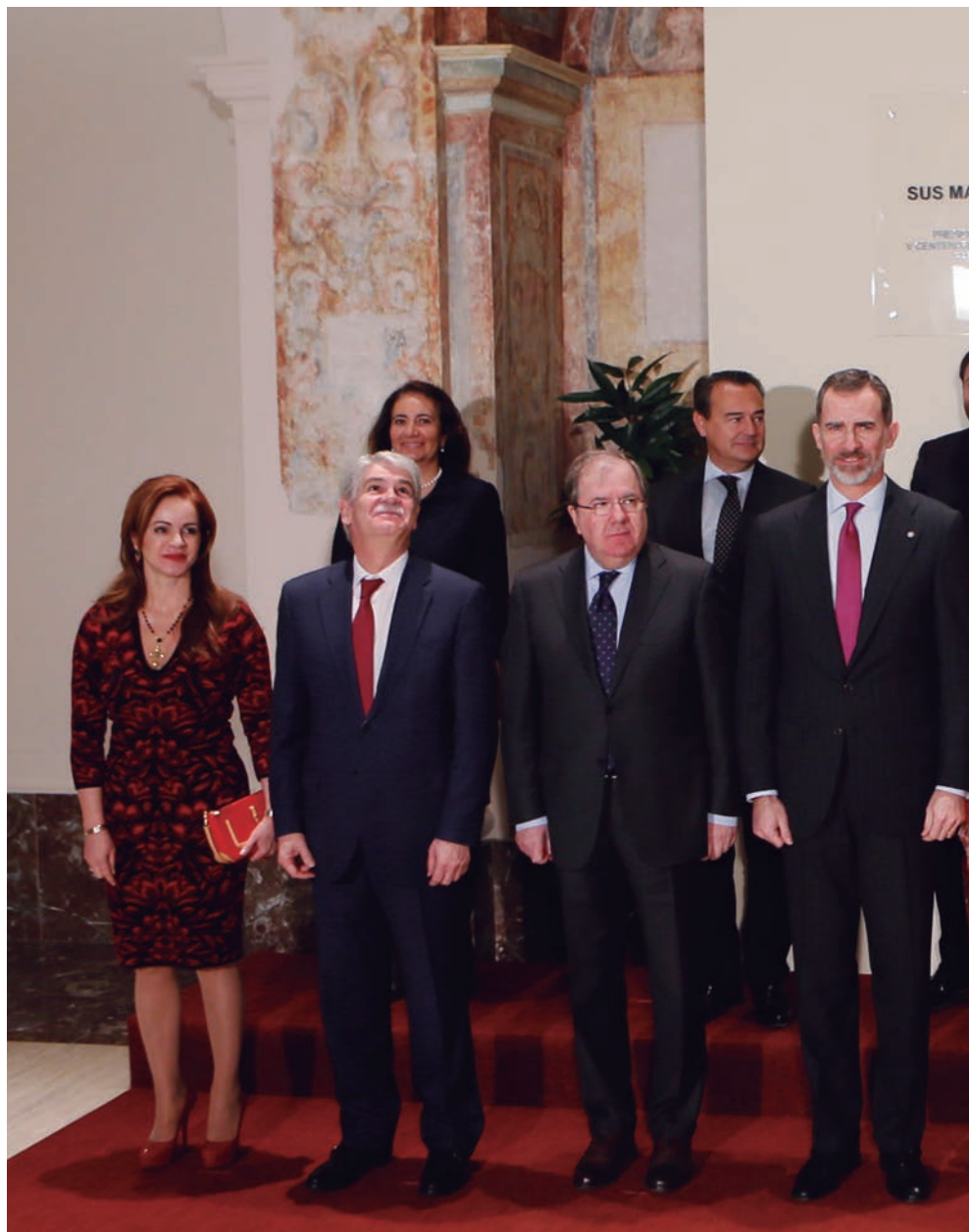
Acto conmemorativo de las Capitulaciones. Con los Reyes, en primera fila, de izda. a dcha., Dastis; presidente de la Junta, Juan Vicente Herrera; ministra de Defensa, María Dolores de

Los Reyes presiden la conmemoración entre Carlos I y Felipe VI