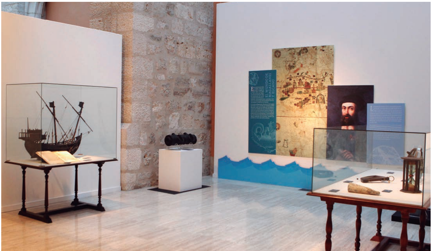
El Monasterio de Nuestra Señora de Prado, de Valladolid, acogió la exposición de Defensa sobre la primera circunnavegación.