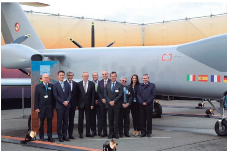
El secretario de Estado participó en la presentación del EuroMALE , el nuevo sistema aéreo pilotado remotamente europeo.

El programa del avión de transporte A400M se encuentra a la vanguardia tecnológica