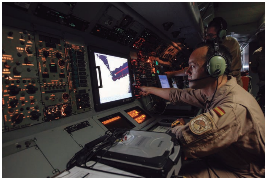
En la cabina del P-3 Orión , el coordinador táctico supervisa la información que obtienen los operadores sobre la situación en el Golfo de Adén.

ciones que comparte con otro P-3 alemán integrado en la operación. En estos diez años, el destacamento aéreo ha rotado en 32 ocasiones y ha efectuado cerca de 11.000 horas de vuelo con una media de 13 misiones por mes.