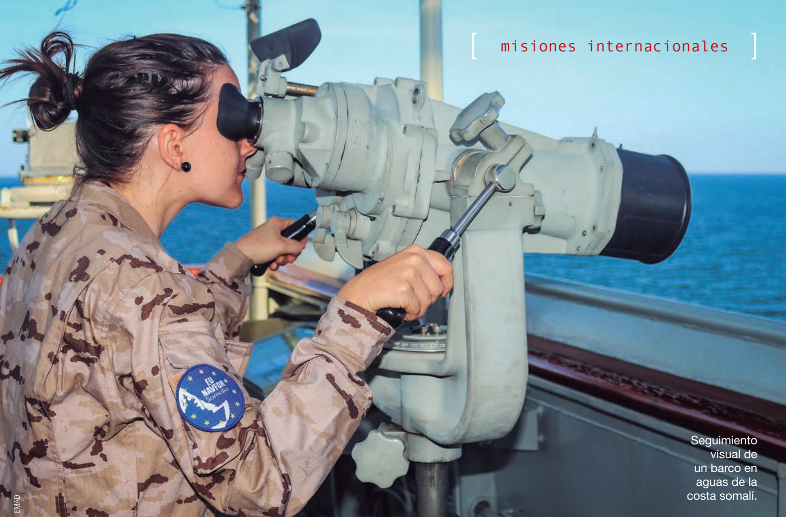
Seguimiento visual de un barco en aguas de la costa somalí.