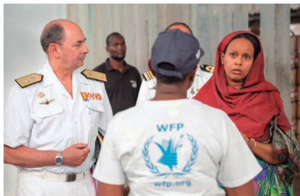
Visita a las instalaciones logísticas del programa mundial de alimentos de la ONU, en Yibuti.

—Quedé muy impresionado. Hacen un trabajo extraordinario, no en vano han