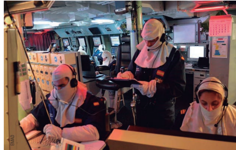
El BAC Cantabria suministra combustible a la fragata noruega Helge en aguas del mar de Noruega. A la derecha, zafarrancho de combate en la fragata Cristóbal Colón . Debajo, francotiradores del batallón Lepanto , de la Brigada Guzmán el Bueno X , en Follidal.