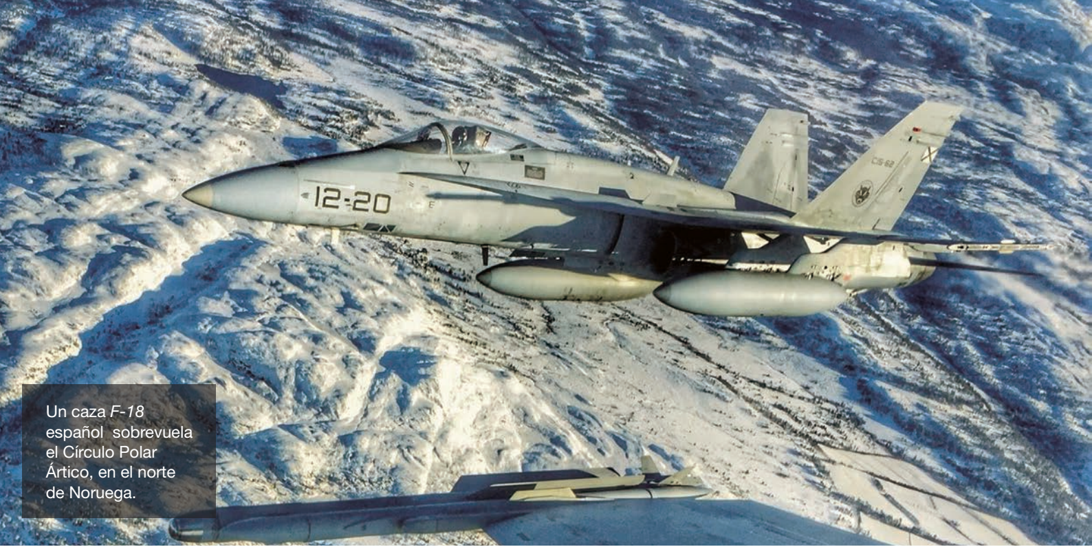
Un caza F-18 español sobrevuela el Círculo Polar Ártico, en el norte de Noruega.