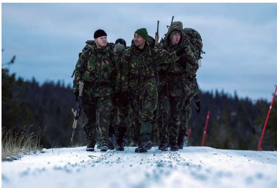
Soldados holandeses del 45 Painfbat se adiestran en el campo de Lillehammer, donde se estableció el cuartel general de la fuerza liderada por Alemania y Países Bajos.