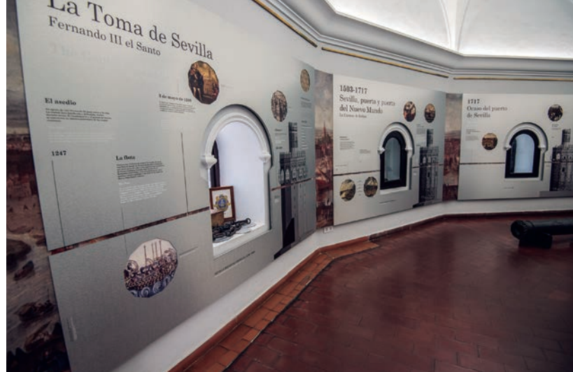
Museo Naval de Sevilla