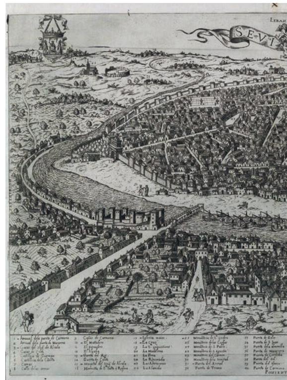
Retrato del almirante Ramón Bonifaz. Grabado de Sevilla (1585), en el que, a la izquierda, se puede observar, reconstruido, el puente «abatido» por el ilustre marino.