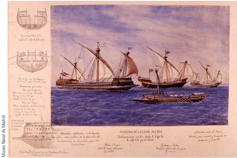
Museo Naval de Madrid