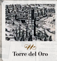
Torre del Oro