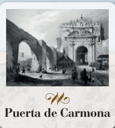
Puerta de Carmona