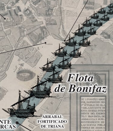
Flota de Bonifaz