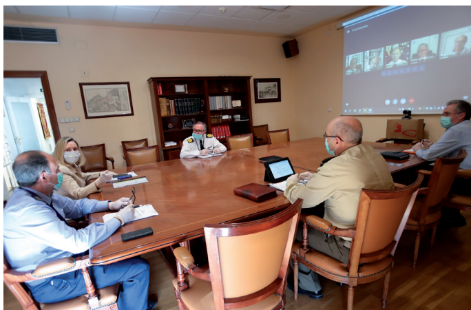
La DIGEREM, acompañada por sus colaboradores, celebra una videoconferencia con los responsables de la enseñanza militar.

Tecnológicamente, la arquitectura del Campus estaba diseñada para un máximo de 500 usuarios concurrentes, y era suficiente. Debido a la intensificación de las actividades del CVCDEF y a que se multiplicaron por cinco los usuarios diarios, ha