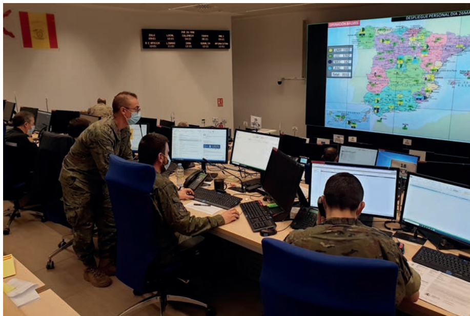
En el Mando de Operaciones, los oficiales analistas estudiaban las peticiones, tanto de apoyo logístico como sanitarias, y determinaban el personal y los medios más adecuados para intervenir.

El esfuerzo principal se ha centrado en las residencias de mayores, donde se descontaminaron 5.301 de toda España, trabajando en equipos de entre dos y seis personas.