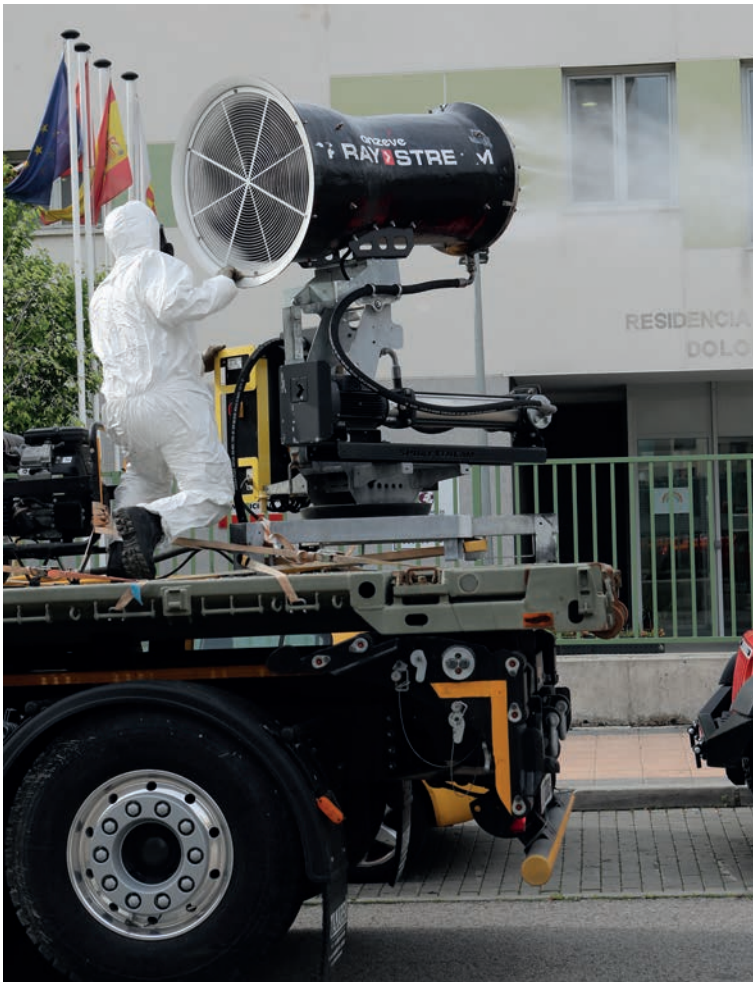
Soldados de la Brigada Paracaidista apoyan la puesta a punto del hospital provisional de IFEMA. Debajo, labores de desinfección —con un cañón nebulizador de la Unidad Militar de Emergencias y en una residencia de ancianos— y transporte aéreo de material sanitario.