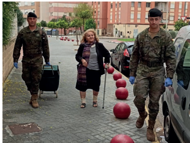
Los militares han estado cerca de la ciudadanía, sobre todo de los más vulnerables. En la foto, ayudan a una anciana a llevar la compra.

El 55 por 100 de las 20.002 intervenciones de Balmis correspondió a las actividades de limpieza y desinfección de espacios públicos. Se realizaron 11.061 y alcanzaron a hospitales, centros de salud y residencias de mayores, en los que se libró el combate en primera línea contra el COVID-19; grandes superficies, entre ellos los pabellones de IFEMA donde se