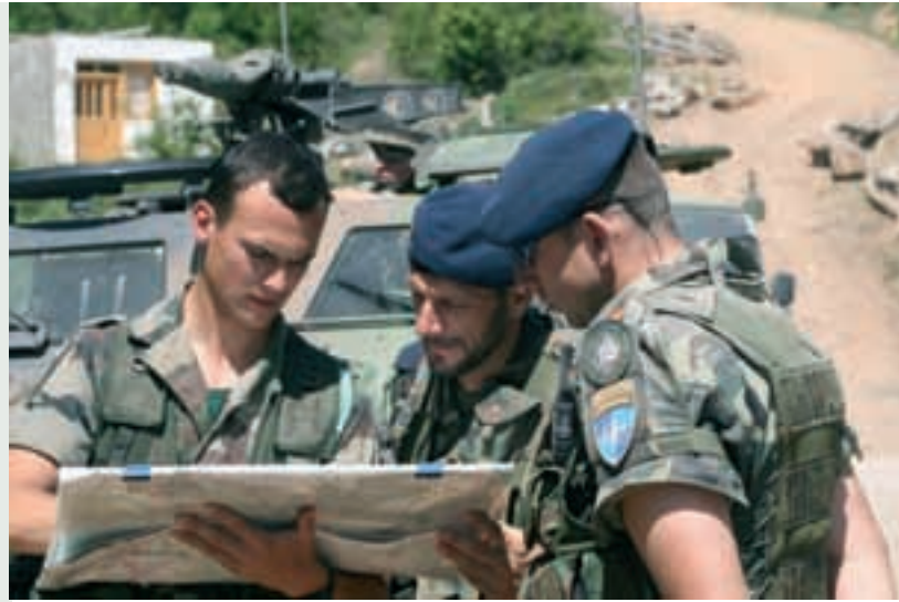
Soldados españoles junto a otro miembro francés de KFOR patrullan en una carretera próxima a Istok.

Desde finales de 2007, la agrupación Ceuta , el decimonoveno contingente español en Kosovo (KSPFOR XIX), continúa con la tarea de garantizar un entorno estable y seguro en su zona de responsabilidad, que abarca 472 kilómetros cuadrados de la comarca de Istok. Además, tienen un destacamento en el valle de Osojane para dar protección a los refugiados serbios que viven en esa zona. La Fuerza española, integrada en la Agrupación Multinacional Oeste de la KFOR, bajo mando italiano, está compuesta por 630 militares, la mayoría procedentes del Grupo de Regulares nº 54 y de otras unidades de la Comandancia General de Ceuta, y de las agrupaciones de Apoyo Logístico nº 21 de Sevilla y 22 de Granada. También, hay militares españoles en el cuartel general de KFOR, en Pristina. El de mayor graduación actualmente es el general de brigada José Alberto Ruiz de Oña, responsable del área de Logística de la fuerza aliada. Por su parte, el coronel Juan Montenegro Álvarez de Tejera, ha relevado recientemente al frente de la jefatura de la Sección de Operaciones del Estado Mayor, al coronel Santiago Cubas Roig, puesto que ocupará durante seis meses.