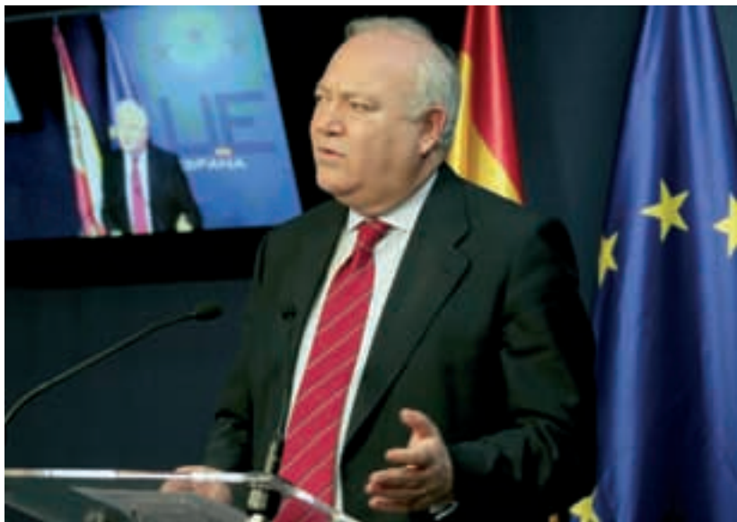
El ministro de Exteriores español explica tras el Consejo de la UE del día 19 su decisión de no reconocer la independencia.