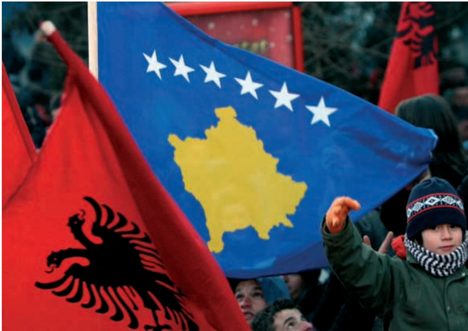
La nueva bandera de Kosovo junto a la del águila bicéfala de los albaneses ondean en las calles de Pristina tras la declaración de independencia.