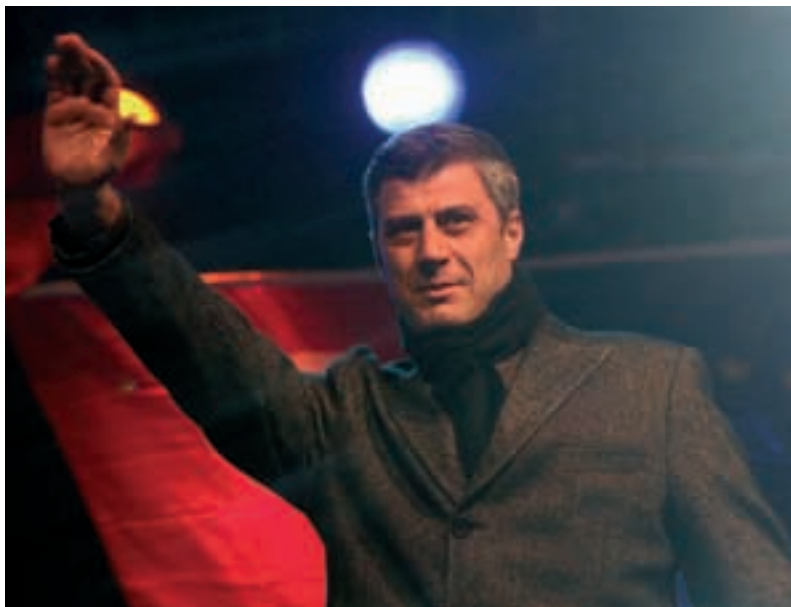
El primer ministro Kosovar, Hashim Taçi, se dirige a la multitud para afirmar que su país es un Estado soberano.